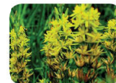
Narthécie des Marais

La rare et majestueuse Gentiane pneumonanthe parée de couleur bleue, s'admire au mois de septembre.