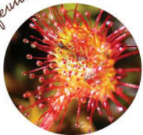
Droséra à feuilles rondes

Souvent considérées comme les joyaux de nos tourbières, ces plantes colonisatrices adoptent une astuce pour trouver l'azote si peu présent dans le sol. Elles capturent et digèrent les petites proies (insectes) qui tombent dans leur piège. Trois espèces sont présentes sur le site de Sérent.