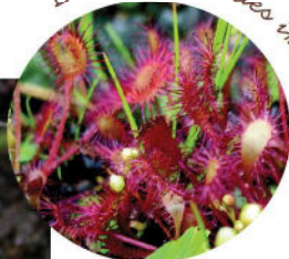
Droséra à feuilles intermédiaires

Souvent considérées comme les joyaux de nos tourbières, ces plantes colonisatrices adoptent une astuce pour trouver l'azote si peu présent dans le sol. Elles capturent et digèrent les petites proies (insectes) qui tombent dans leur piège. Trois espèces sont présentes sur le site de Sérent.