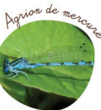
Agrion de mercure