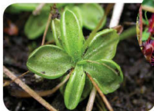
Crassette du Portugal